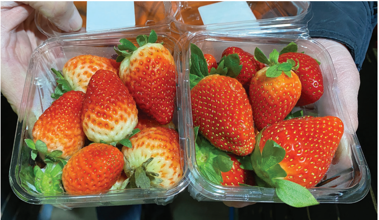
Hình 4. Các đặc điểm mang vấn đề của các giống cho quả sớm đầu mùa: cả hai giống Red Rhapsody và Fronteras (hình trái) đều bị nhiều vai xanh trong khí hậu của Perth, đặc điểm này làm cho thành phẩm trở nên không thu hút đối với người tiêu dùng. Giống Festival (hình phải) nhìn bắt mắt, và thu hút người mua nhưng thường thì không có nhiều vị ngọt và không được mua lại bởi người tiêu dùng. Giống Fronteras cũng thường có vị nhạt và có thể trở nên quá mỏng nước và mềm quả khi càng về cuối mùa, do đó nó có cả hai điểm trừ của việc không được bắt mắt và nhạt vị.

Việc theo dõi và duy trì một cách chính xác độ ẩm của đất cũng rất quan trọng. Tưới quá nhiều nước sẽ làm trôi các chất dinh dưỡng ra khỏi vùng rễ, gây lãng phí và có thể tạo ra sự thiếu hụt dinh dưỡng. Tưới không đủ nước cũng làm gián đoạn việc các chất dinh dưỡng được đưa đến cây (cũng gây ra sự thiếu hụt) và gây tụ muối làm hư hại rễ và khiến chúng dễ bị nhiễm các bệnh truyền qua đất. Để có kết quả tốt nhất, nên theo dõi và điều chỉnh lịch tưới bằng thiết bị theo dõi độ ẩm của đất ngay trên khu trồng.