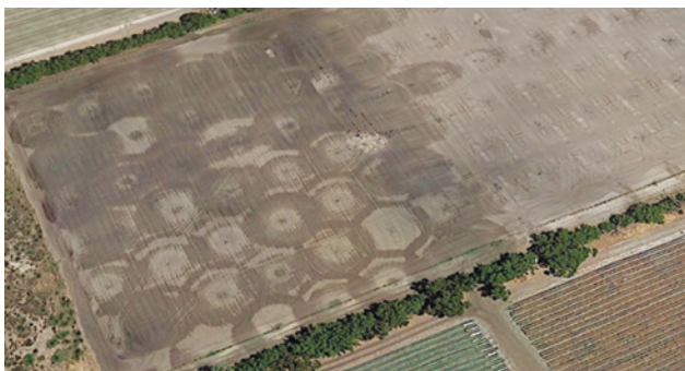
Hình 3. Thực hành tốt trong việc bón phân là điều thiết yếu để thành công khi trồng giống Fortuna. Đất phải được làm ẩm một cách đồng đều để đạt được hiệu quả khi xông khử đất, vì các chất xông khử sẽ không đi qua được các mảng đất khô. Hình ảnh từ trên cao này cho thấy một mô hình phổ biến của các vòi phun nước làm ẩm đất trước khi thực hiện quá trình xông khử hay được thấy ở các vùng của Perth. Áp suất và tốc độ phun khác nhau từ các vòi khiến việc làm ẩm đất không đồng đều dẫn đến việc phân bố các khí xông khử cho cả khu đất bị kém đi.

Sự chuyển đổi sang việc trồng thu hoạch và sản xuất trong nhà ni-lon bằng cách sử dụng chất nền nhân tạo trên mặt dàn cũng được xem là một cơ hội tốt để cải thiện chất lượng, tính lợi suất và cũng là một cách để giải quyết tình trạng thiếu nhân công.